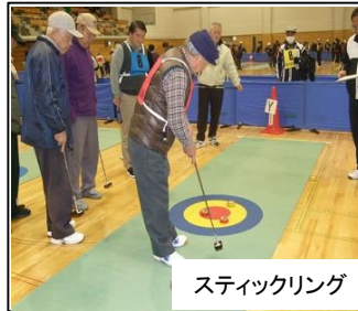
スティックリング

カローリングからヒントを得て誕生。カラフルなジェットローラーをポイントに向けてスローイングして得点を競う。