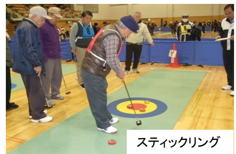
スティックリング