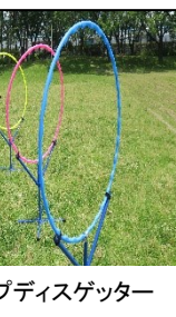
フープディスゲッター