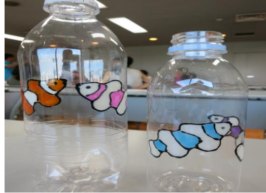
ボトルアート教室(ボトル内部にお絵かきをします)